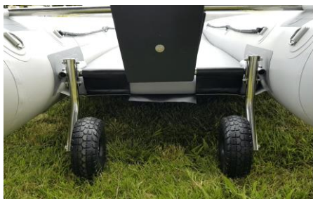
Sustav krmenih kotača s brzim otpuštanjem