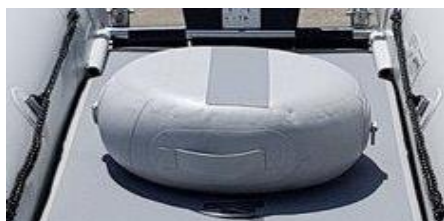
Odvojivo plosnato sjedalo na napuhavanje