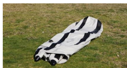
RE-TUBING, komplet zamjenskih tubusa sa spojnom podnicom