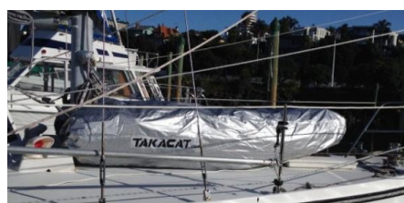
OXFORD zaštitna navlaka za gumenjak