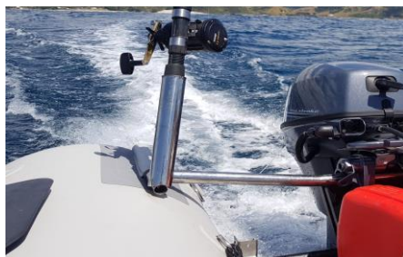
Držaci štapova za ribolov i / ili jarbola za noćnu navigaciju