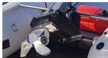
Hydrofoil Permatrim™, anti-kavitaciona i anti-ventilaciona ploča za nogu motora