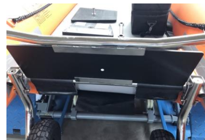
“SPLASH GUARD” zaštitna ploča protiv prskanja