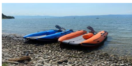
Obojite svoj TAKACAT