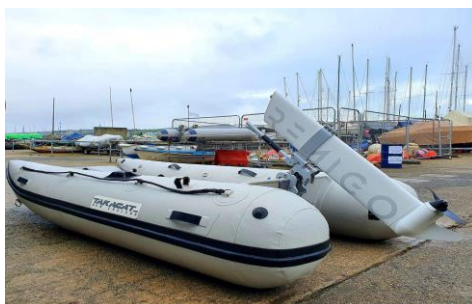
REMIGO ONE (električni)