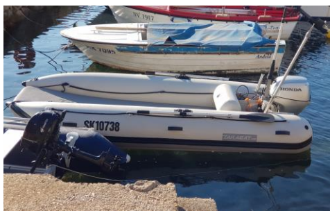
HONDA 2,3 – 20 KS