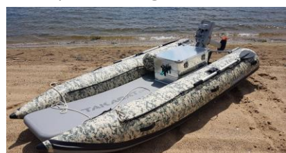
Kamuflažni uzorak tubusa