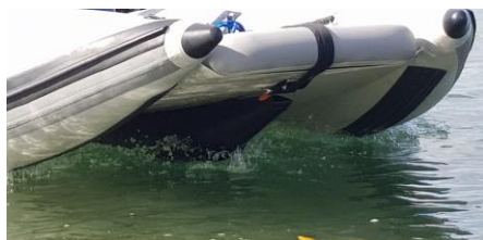
SPEED TUBE "Wave-Piercer", brzinski tubus/probijač valova